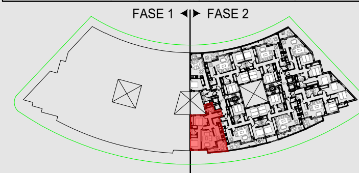
Portal 2, Escalera 2, Planta 3 a , Vivienda D